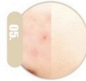
05. Trajtimi i akneve