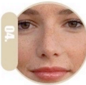
04. Eleminim i pigmenteve sikloasma interaktibile, shenjat nga plakja, piklat apo njollat