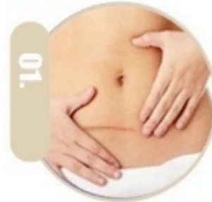
01. Strija, eliminon shenjat nga operacioni djegja dhe aknet