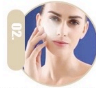
02. Rigjenerim si dhe rishtresim i likures dhe permiresim nga demtimet e diellit