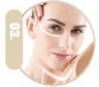
03. Eleminim i rrudhave dhe shtrengim i lkures