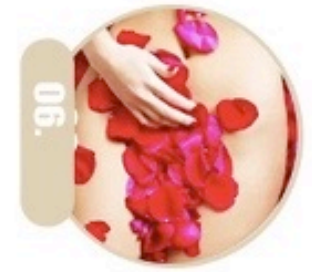
06. Trajtimi vaginal, ngushtimi, zbardhimi dhe optimalizimi